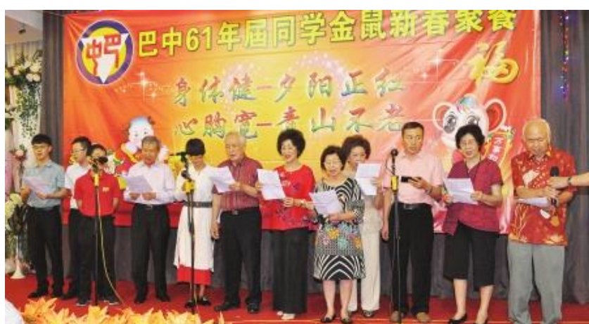
61 年届同学和巴中三语学校老师合唱