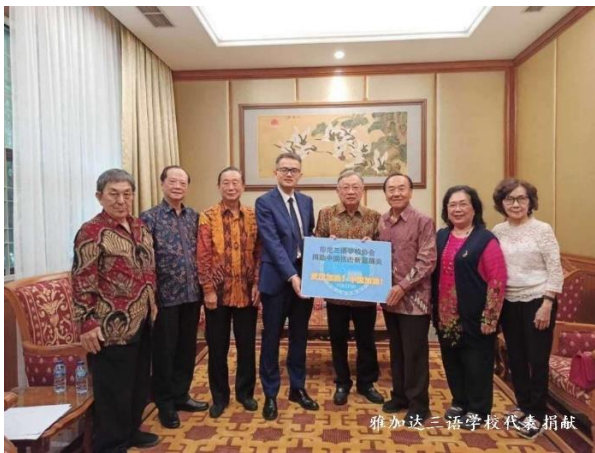
雅加达三语学校代表捐赠